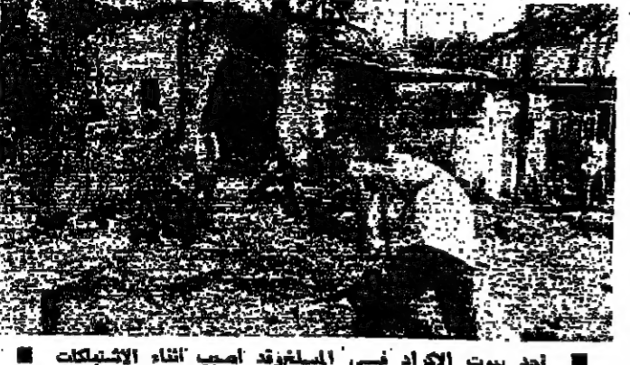
أحد بيوت الكراد في المسلوقة أصيب أثناء الاشتباك

كان اليوم اكثر شمولاً في بيروت وضواحيها، لكن نشاط القناصة والساعين الى الإيذاء على التوتير، استمر يوماً آخر، فنقلت فتاة في الشياح، ورجل في محلة النهر، وحصل اصطدام في الأثرية.